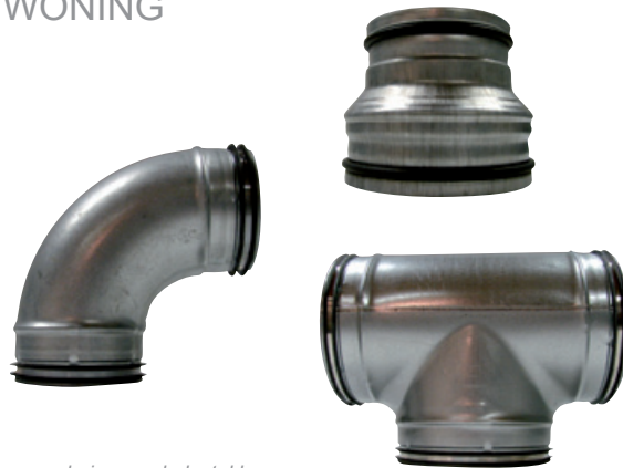
buizen en hulpstukken