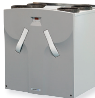
ComfoD 550 van Storkair