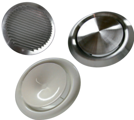
roosters voor extractie en pulsie